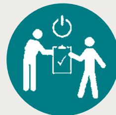
Cumprimento dos controles de segurança

Em 2022, reforçaremos a divulgação das 9 Regras que Salvam Vidas para todos os colaboradores e terceiros por meio das campanhas de conscientização e da Semana Interna de Prevenção de Acidentes do Trabalho (SIPAT), realizada anualmente sob a coordenação da Comissão Interna de Prevenção de Acidentes (CIPA).