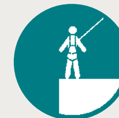
Trabalho em altura