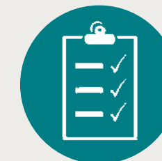
Autorização de trabalho