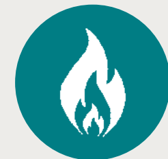
Trabalho com calor