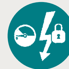
Isolamento de energia