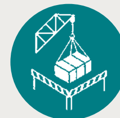
Içamento mecânico seguro