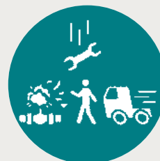
Linha de fogo